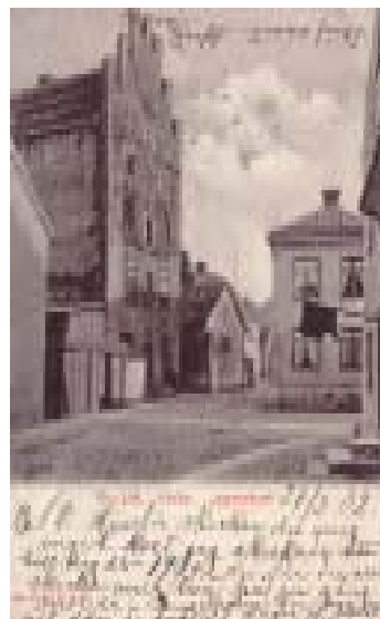
Bild 5. No 136. Visby Apoteket

Vi ger här ett exempel på skillnader inom den vanligt förekommande varianten 1.7.A (se Bild 5 till höger), som vi betraktar som den ursprungliga serien för de numererade FWH-korten: