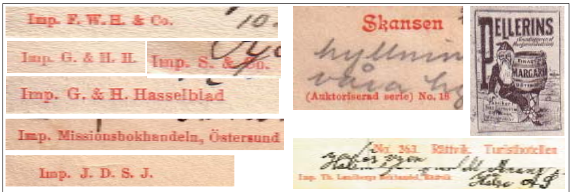
Bild 2. Kollage över förlagsbeteckningar